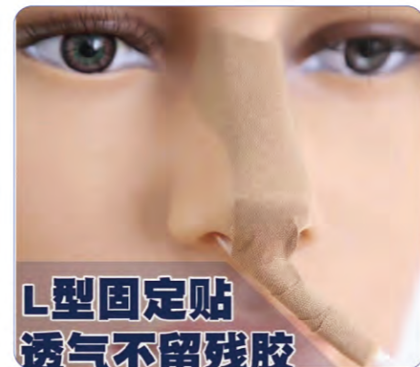
L型固定贴 透气不留残胶